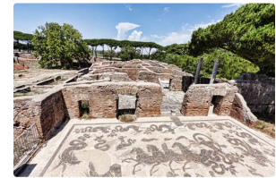
Romeinse opgravingen van de havenstad

Op dinsdag gingen we als eerste naar de catacomben van San Callisto, waar een gids ons een rondleiding gaf. Daarna gingen we naar Ostia Antica, de ruïnes van een stad uit de oudheid. Deze mochten wij zelf verkennen, en het rondlopen tussen gebouwen van meer dan 2000 jaar oud was erg gaaf.