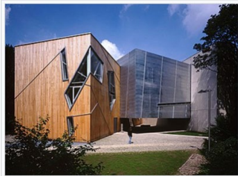
Het Felix-Nussbaum-Haus in 1998

Aansluitend zijn zij naar het Felix Nussbaum-haus geweest, waar leerlingen zelfstandig in kleine groepjes het museum konden bezoeken. Zij konden zelf de beklemmende sfeer, die bewust door de vormgeving van het museum is gecreëerd ondergaan. Daardoor werd de boodschap van vele schilderijen van Nussbaum, een in de Tweede Wereldoorlog gedeporteerde en vermoorde Joodse kunstenaar, nog extra benadrukt.